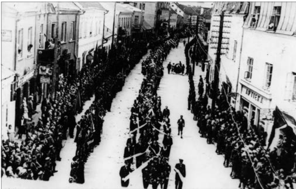
Tautos didvyrių laidotuvs

kilimą, aviacijos specialistai pavadino jį rizikingiausiu ir drąsiausiu transatlantinių skridimų istorijoje.