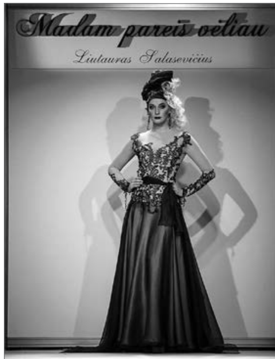
Liutauro Salasevičiaus sukurtas modelis