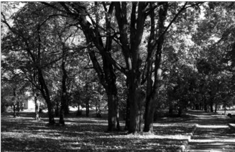
Pakiršinio dvaro parke