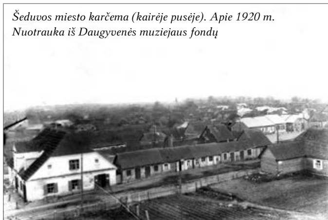
Šeduvos miesto karčema (kairėje pusėje). Apie 1920 m.

1859 metais dvare buvo spirito varykla. Stovėjo prie kelio Šeduva–Panevėžys, ties įvažiavimu į Rau-