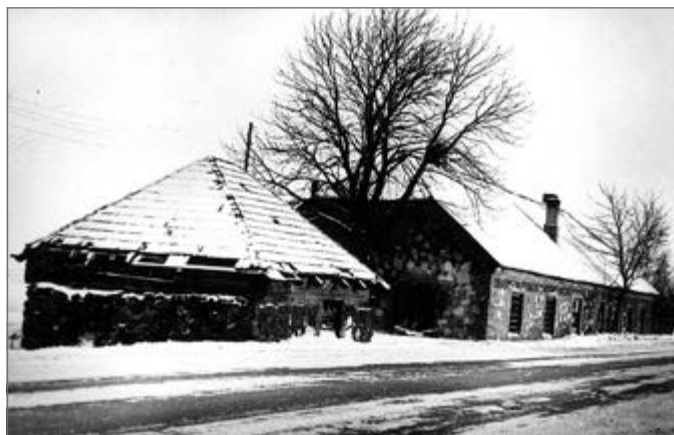
Raudondvario dvaro pakelės karčema ir ledainė (kairėje pusėje). 1978 m.

dondvarį. Ji buvo pastatyta XIX šimtmečio pradžio- je, kai Šeduvos dvaras buvo nugriautas ir iškeltas atokiau nuo miesto, prie Daugyvenės upės. Karče- ma buvo išsteto stačiakampio plano, akmenų mūro, pusvalminiu medinių konstrukcijų stogu. Pietinis fasadas orientuotas lygiagrečiai su keliu. Rytiniame pastato gale buvo įrengtos stadalos, skirtos keliauto- jų arkliais ir transporto priemonėms. Vakariniame gale – patalpos keliautojams, ten gyveno karčemos nuomotojas. Šalia karčemos vakarinio galo stovėjo dar vienas nedidelis akmenų mūro ir medžio sieno- mis keturšlaitis pastatėlis. Pokario metais karčemos pastate buvo Šeduvos žemės ūkio technikumui-tary- binio ūkio mechaninės dirbtuvės. Abu pastatai nu- griauti apie 1978 metus, platinant ir tiesinant Šedu- vos–Panevėžio plentą.