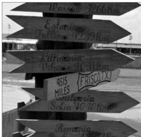
Rodyklės Kandahare vis primindavo milžiniškus atstumus nuo namų...

sraigtasparnių variklius. Anksti rytą būdavo truputį vėsiau, todėl keldavomės gana anksti. Dieną kiekvienas pagal savo paskirtį ir specializaciją dirbdavome – kas skraidydavo ar mokydavo kitus skristi, kas remontuodavo ar mokydavo kolegas remontuoti sraigtasparnius. Ir taip diena iš dienos.