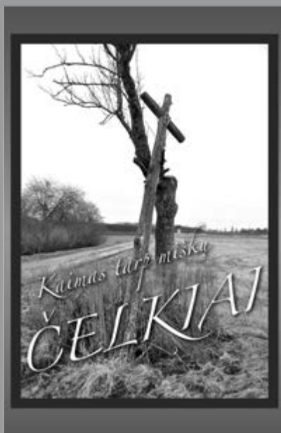
„Kaimas tarp miškų Čelkiai“