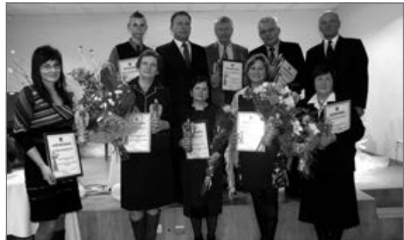
Radviliškio viešosios bibliotekos informacija

Gruodžio 19 d. Viešojoje bibliotekoje surengtos rajono savivaldybės metų apdovanojimo „Gerumo šviesa“ – statulėlių „Gerumo angelas“ – įteikimo iškilmės.