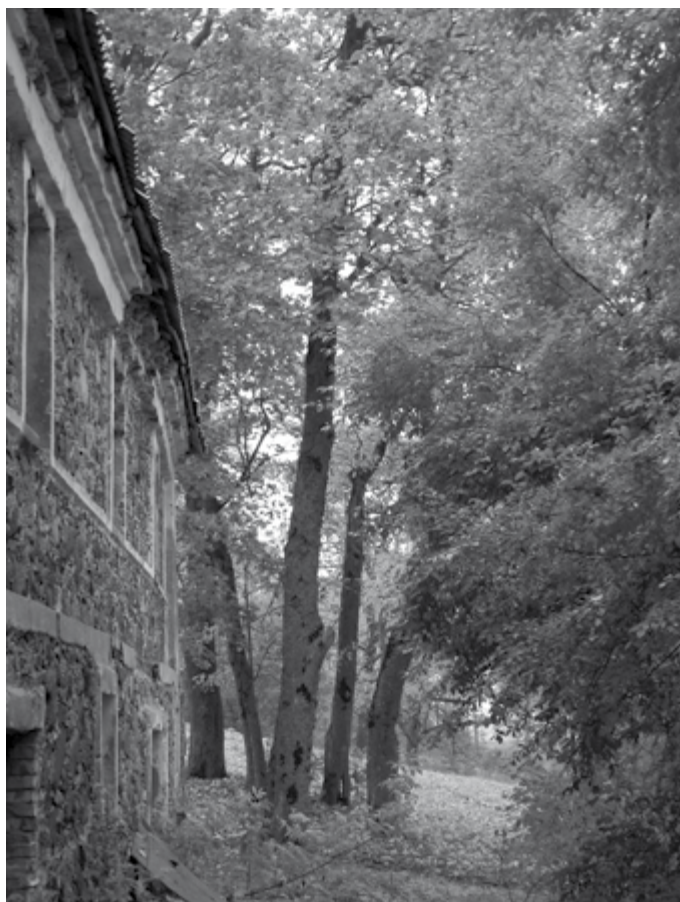
Senajame Grinkiškio parke