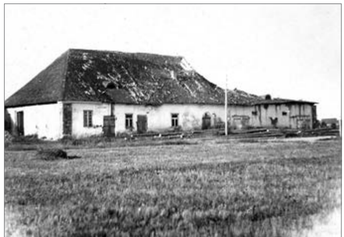
Švaininkų pakelės karčema. 1941 m.

Karčema pastatyta XIX amžiaus pabaigoje iš plūktoto molio mūro. Ji buvo ištęsto stačiakampio plano, keturšlaičiu stogu. 1941 metais jau buvo apgriuvusi. Stovėjo taip pat prie kelio Šeduva–Panevėžys.