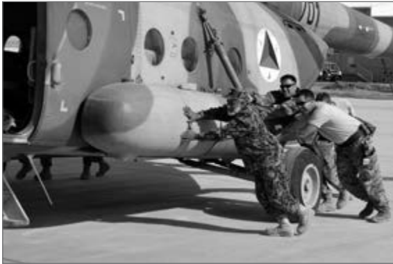
Misijos nariai savo darbo aplinkoje