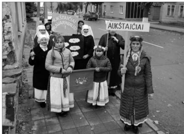
Ruošiantis tarmių atstovų eisenai Šeduvoje