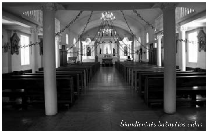
Šiandieninės bažnyčios vidus