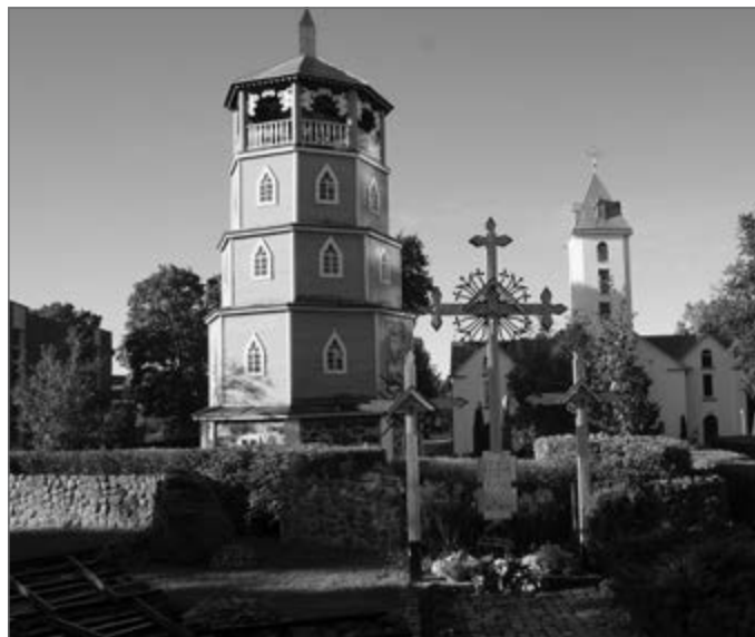
Architektūros paminklas – medinė varpinė. Trys kryžiai su simboliniu „Skausmo ir kančios taku“ tarsi papildo bažnyčios ir varpinės kaimynystę

Pasikeitęs ir pačios bažnyčios veidas: nauji presbiterijos baldai, altorius, suolai besimeldžiantiesiems,