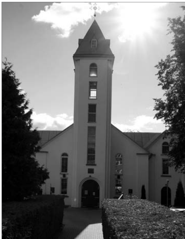
Radviliškio Švč. Mergelės Marijos Gimimo bažnyčia

Savo 445 metų sukaktį atšventęs Radviliškis didžiuojasi, kad ir pačiame jo centre stovinti, Šiaulių vyskupijai, Radviliškio dekanatui priklausanti bažnyčia yra viena seniausių šiame krašte ir vis atsinaujinanti.