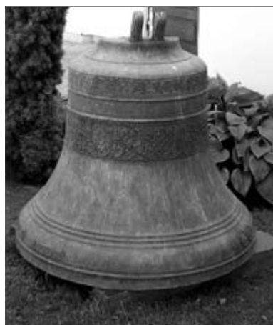
Bažnyčios šventoriuje rymo per gaisrą suskilęs senasis bažnyčios varpas