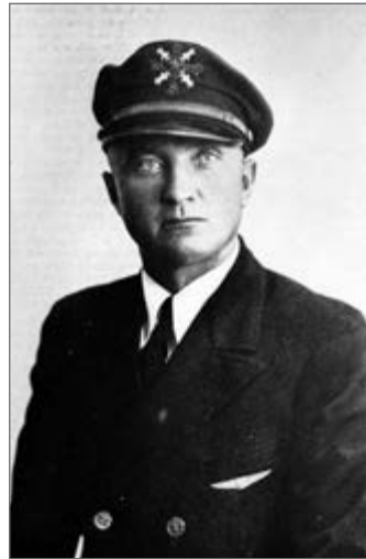
Steponas Darius, Stasys Girėnas