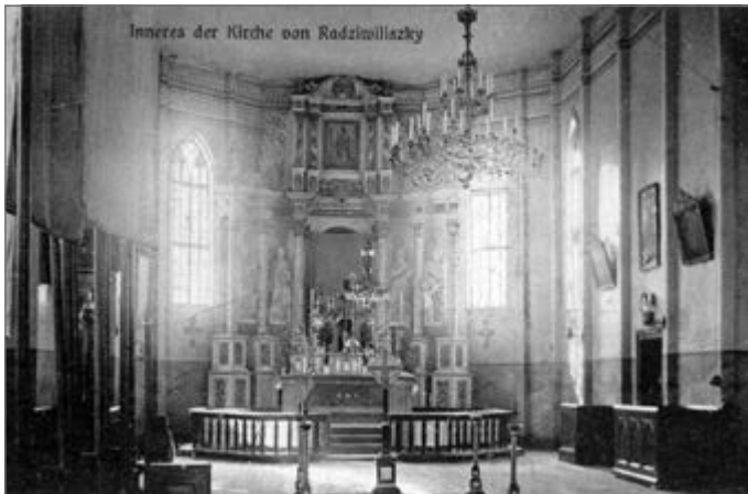
Taip atrodė parapijos bažnyčios vidus 1916 m.