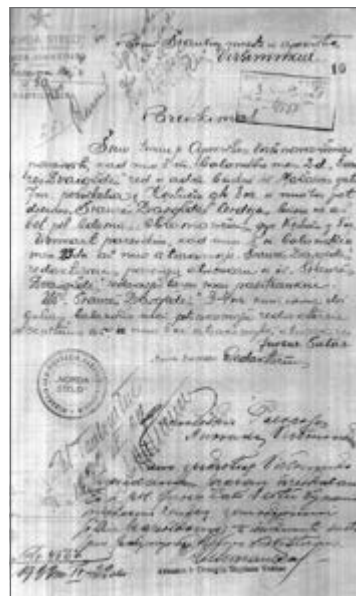
Dokumentai dėl laikraščio esperanto kalba leidimo