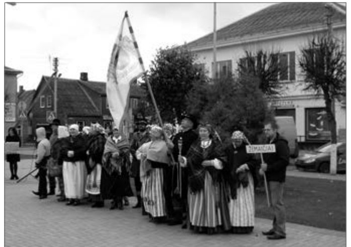
Tarmių festivalis prasidėjo Šeduvos miesto aikštėje