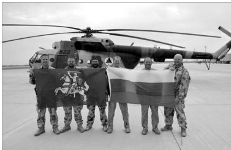
OPMG-5 lietuvių kolektyvas su Lietuvos valstybine ir istorine vėliavomis

Misijos karių kasdienybė buvo gana įdomi. Pradėsiu nuo to, kad ne darbo diena Afganistane – penktadienis, o visos kitos savaitės dienos yra darbo. Taigi šeštadieniai ir sekmadieniai buvo užimti tarnyboje. Šeštą valandą ryto dauguma karių jau išvykdavo į aerodromą. Atėjus vasarai, išvykimo į tarnybos vietą laikas dar paankstėdavo, nes tokį ritmą diktodavo karštis. Įdienesius prie metalo be pirštinių tiesiog neprisiliesi, jau nekalbant apie karščiu alsuojančius