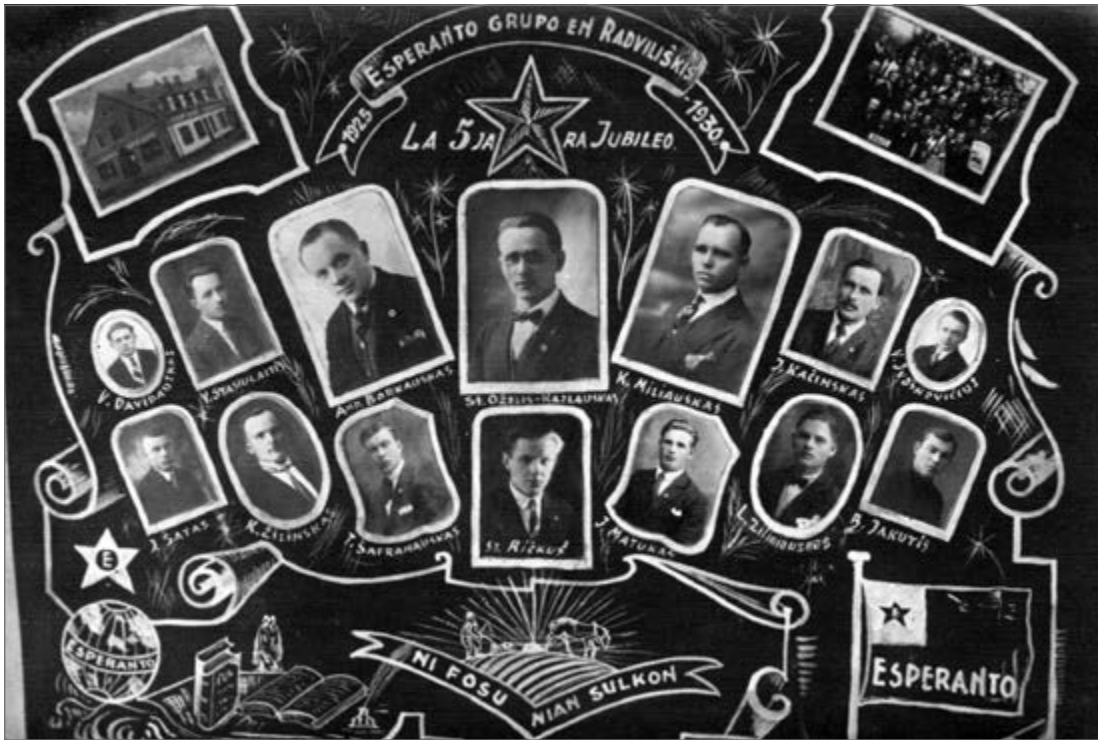
Radviliškio esperantininkai.

tautinę kalbą buvo esperanto kalbos atsiradimas. Jos kūrėjas L. Zamenhofas (1859–1917), pasivadinęs daktaro Esperanto slapyvardžiu, 1887 m. Varšuvoje išleido pirmą šios kalbos vadovėlį. Kalba visuomenei pasirodė lengva, paprasta ir paplito, nugalėdama kitas dirbtines tarptautines kalbas.