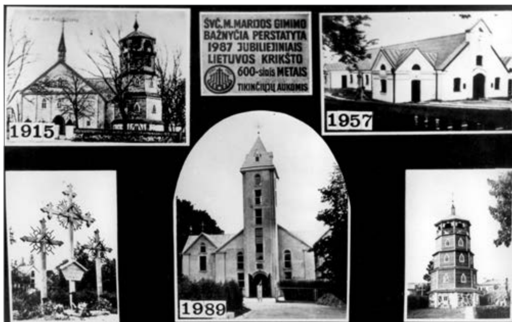
Parapijos bažnyčia įvairiais savo istorijos laikotarpiais

džiai, nes buvo samdoma penkiolika statybininkų ir dar į talką kasdien ateidavo dešimt vyrų, be to, padėdavo ir bažnyčios patarnautojai – ministrantai, kurie tiesiog lenktyniaudavo, kuris greičiau atliks darbus. Malonu, kad iš tų patarnautojų dabar dauguma yra tapę kunigais“. Jau tų pačių metų spalio mėnesį pradėta melstis naujojoje bažnyčioje. Joje buvo įrengtas šildymas, todėl vidaus darbai vyko ir toliau. 1988 metų liepos 20-ąją, per titulinius Šveečiausiosios Mergelės Marijos Škaplierinės atlaidus pakviestas kardinolas Vincentas Sladkevičius pašventino pastatytąją Radviliškio bažnyčią ir pasidžiaugė jos akustika, išvaizda, parapijiečių ir visų rėmėjų atliktu kilniu, didžiuliu darbu. Naujoji bažnyčia pastatyta tikinčiųjų aukomis per stebėtinai trumpą laiką – vienerius metus. 1991 m. ji rekonstruota, paaukštintas bokštas.