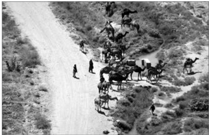
Įprastas vaizdas iš sraigtasparnio Kandaharo provincijoje – vienkuprių kupranugarių kaimenė, sustojusi malšinti troškulį

džiui, labai linksma buvo gaminti šaltibarščius iš vietinių produktų. Ir rezultatas visus nudžiugino, ir – svarbiausia – visiems patiko pats gamybos procesas.