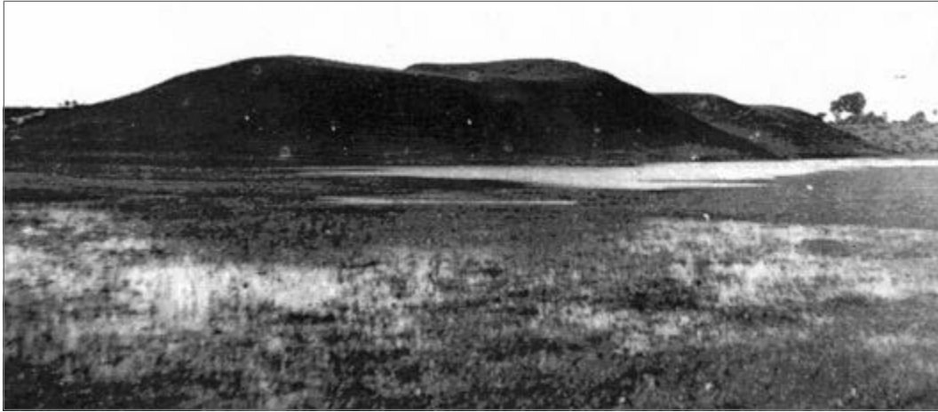
Tarpukario piliakalnis. Fotoreprodukcija