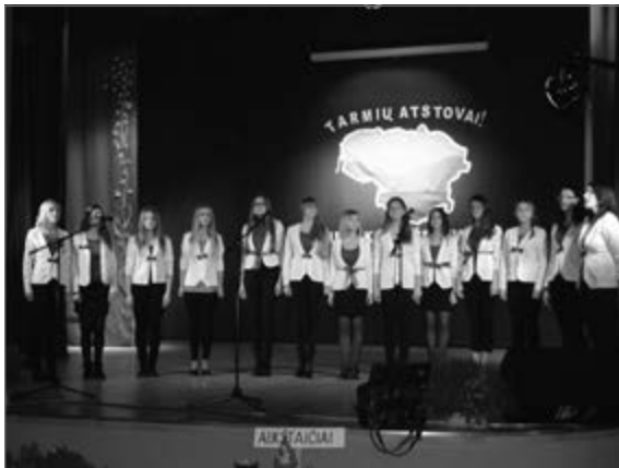
Renginys buvo skirtas įvairaus amžiaus žmonėms