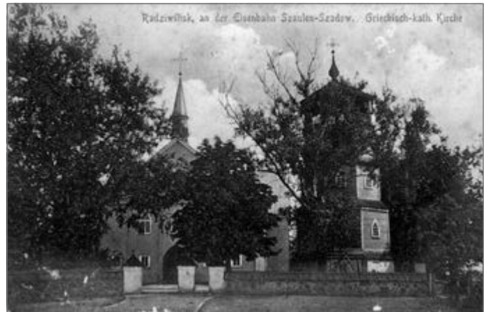
Mažai kas beprisimena tokią Radviliškio katalikų bažnyčią...

Tuo metu Radviliškio parapija buvo jau gana didelė: 1940 metais ji turėjo 8923 katalikus.