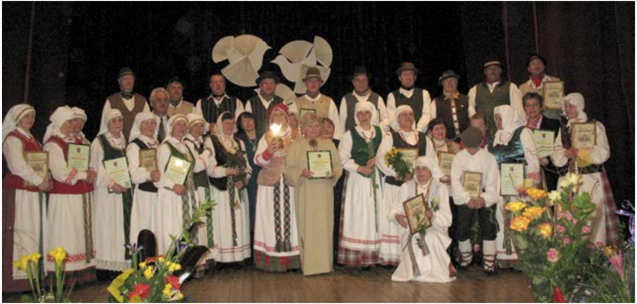
Folkloro kolektyvas „Dainoriai“