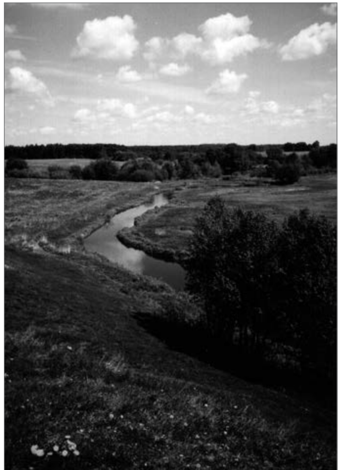
Daugyvenė prie Raginėnų piliakalnio.

Ilgainiui piliakalnyje galėjo būti įrengta pagoniška šventvietė. Beje, biolokaciniai tyrimai (Egidijus Prascevičius) čia rodo buvus deivės Raganos šven-