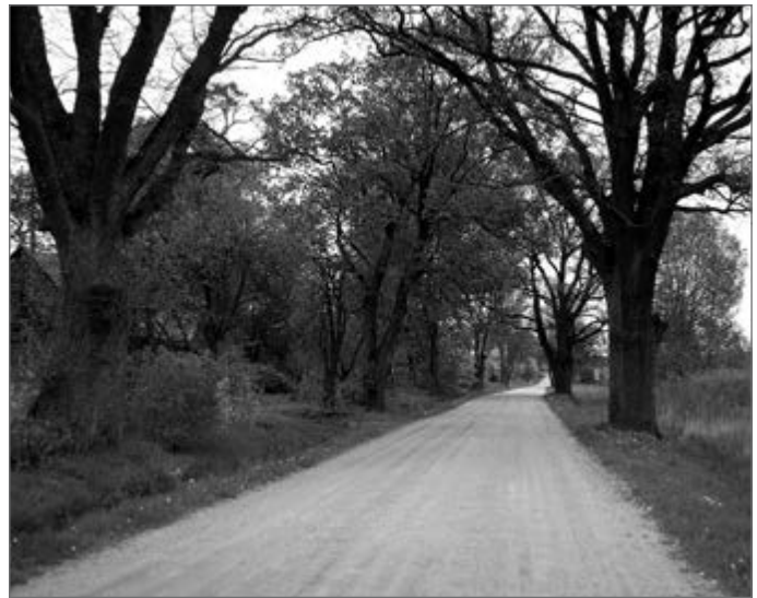
Metieškelis (arba Metiežkelis) per Mažuolių kaimą link Legečių. Taip vadinamas 1863 m. sukilėlių garbei