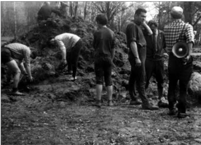
Norinčiųjų tvarkyti legendinių lakūnų sodybas netrūko