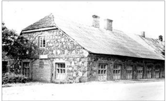
Kleboniškių kaimo pakelės karčema (vėliau Pakalniškių pradinė mokykla). 1983 m.

1785 metais Smilgių parapijoje buvo 14 karčemų, priklausiusių įvairiems savininkams. Smilgių klebonas turėjo tik vieną – miestelyje.