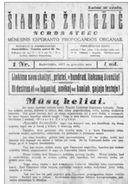
Radviliškio esperantininkų leidinys