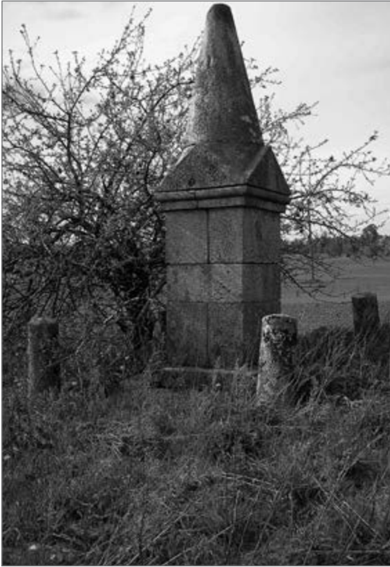
1863 m. sukilėliams skirtas paminklas Dvarčių kaime