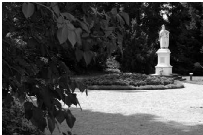
Burbiškio parko vertybė – ir paminklai

Nederamai buvo primirštas 184-asis Pakiršinio parkas, kurį teigiama kitados priklausius įžymiajam XIX a. inžinieriui Stanislovui Kerbedžiui (1810–1899), pasižymėjusiam įvairiose Rusijos imperijos vietose pastatytais tiltais ir tuneliais, gimusiam kitame įspūdingame dvare – kaimyninio Panevėžio rajono Naudvaryje. Sovietmečiu gerokai deformuotas įkurdintų melioratorių bazės, Pakiršinio sendvaris pasižymi išplėta tvenkinių sistema, kai kuriomis dendrofloros retenybėmis – juodosiomis ir kedrinėmis pušimis, skiepytomis liepomis, geltonžiedžiais kaštonais, įkomponuotu senu vaismedžių sodu. Dvare ypač išskirtinas, kaip pabrėžia naujasis „Lietuvos kelių atlasas“, XVIII a. vid.–XX a. pr. išlikusių lauko akmenų ir raudonų plytų mūro pastatų kompleksas. Gera, kad šį sendvarį siekiama atgaivinti, kad jis pritaikomas vietos