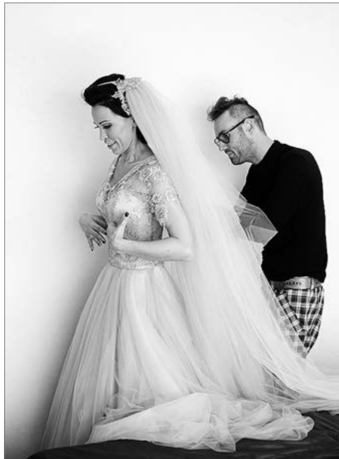
Vestuvinės suknelės – vieni iš populiariausių šio stilisto kūrinių

klausimas pašnekovams – ko palinkėtumėte gimtojo krašto žmonėms? Jūsų atveju norėtumėte truputėlį pakeisti. Šiaip ar kitaip – Radviliškis yra provincija, atitolusi, pavyzdžiui, nuo Vilniaus. Tad ką patartumėte jos jaunimui, kitiems gyventojams, kurie neabejingi grožiui, kad ir mes neatsiliktume nuo mados naujovių, šviežiausių jos ieškojimų ir atradimų.