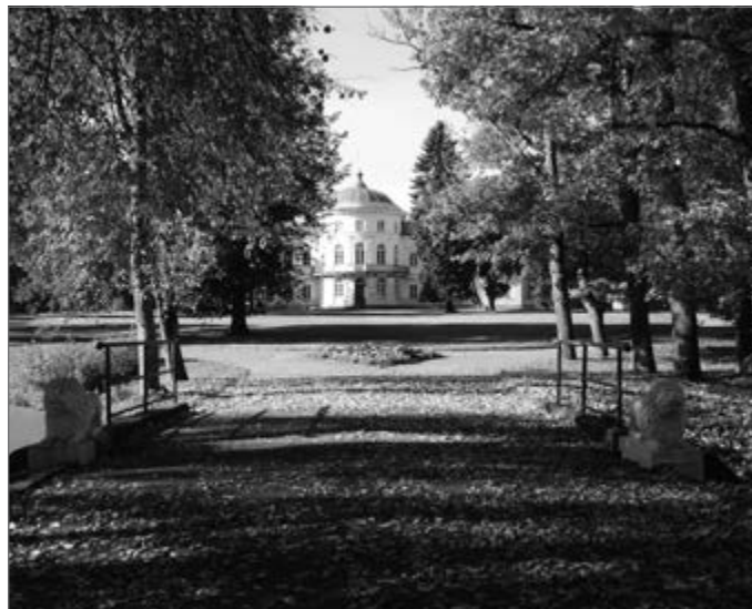
Baisogalos dvaro parke

Prie žymiausių priklauso ir 26-asis kompleksiniu vertinimu Baisogalos vėlyvojo klasicizmo dvaro ansamblio parkas, sukurtas prieš 150 metų (rūmai pastatyti 1857 m.) Komarų giminės iniciatyva. Baisogala 1938 m. „Vadovo po Lietuvą“ pateikiama kaip pavyzdinis Vladislavo Komaro ūkis, kur žemės reformos palikta ūkininkauti neapkarpyta 1200 ha žemėnauda, dirbo 100 darbininkų; be laikytų 100 arklių, jau buvo įsigyti našiam ūkiui 5 traktoriai. Sovietmečiu dvaras pritaikytas čia įsteigtam Gyvulininkystės institutui, pagal išgales ansamblį toliau globojusiam, taip išvengus daugelį dvarų ištikusio niokojimo ir bent iš dalies pritaikius čia sukauptą ūkio patirtį. Parką labai vertino ir peizažiniu įspūdžiu, ir dendrologine sudėtimi (be gausių savaiminių, čia aptikti per 40 svetimžemių medžių ir krūmų taksonų) minėtasis kolega L. Čibiras, tai tyrinėjęs PRI rengtam architektų Algio Knyvos ir Saulės Daubarienės projektui. Teko lankytis parke su juo, taip pat kelis kartus vėliau, pavyzdžiui, 2005 V 07 su Vilniaus bajorų karališkąja draugija. Tada matėsi