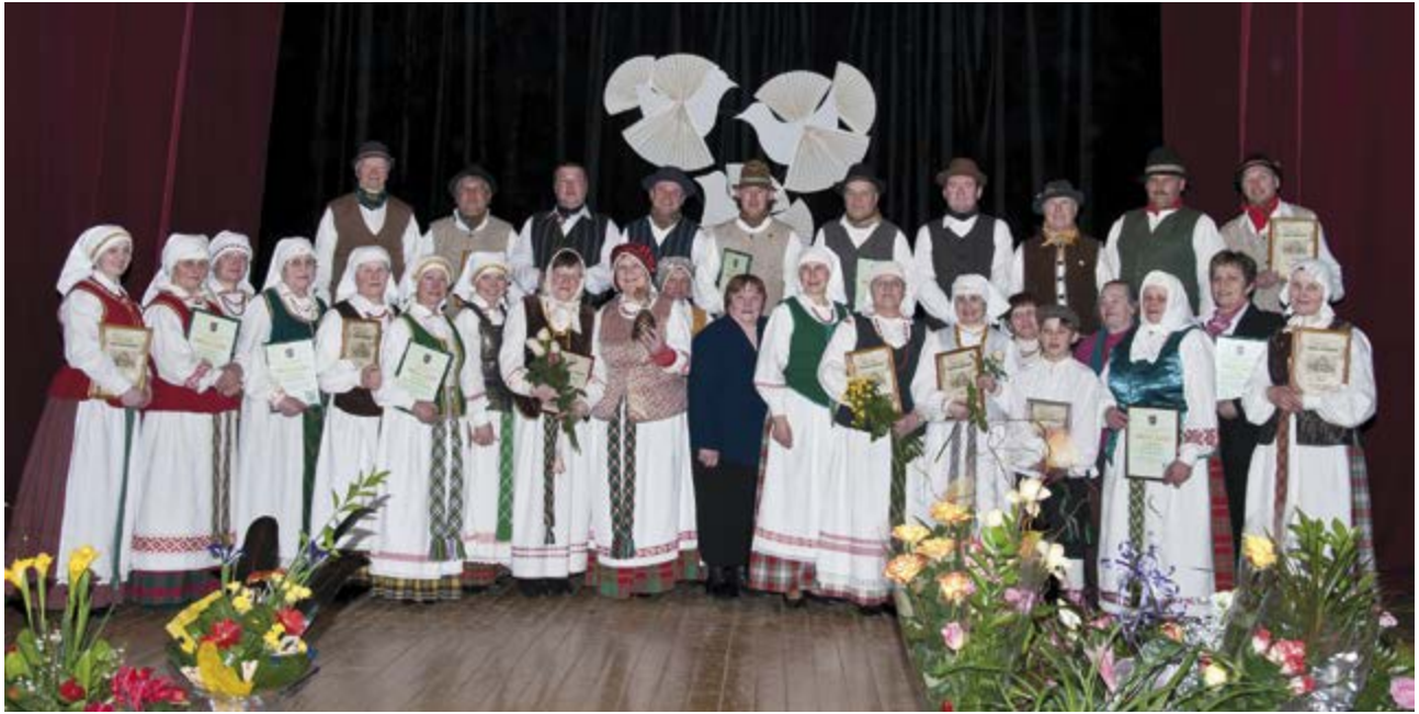
„Dainoriams“ – 30 m.