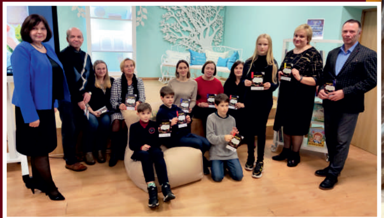
Akcija, „Vasara su knyga“ apdovanojimai