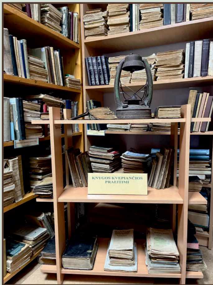
VB senieji leidiniai yra skaitmeninami

Didelį įspūdį paliko ekskursija į Skaitmeninimo laboratoriją, Fizinių ir technologijos mokslų centrą, kuris atlieka ne tik mokslinius tyrimus, tačiau ir kasmet suteikia užsakomųjų medžiagų matavimo, analizės paslaugų šimtams įmonių iš įvairių gamybos ir paslaugų sektorių Lietuvoje ir užsienyje. Čia dirba kvalifikuotų specialistų komanda, jau daugiau kaip 20 metų vystanti mokslinius tyrimus ir technologijas branduolio fizikos, ir branduolio bei masių spektrometrijos srityse.