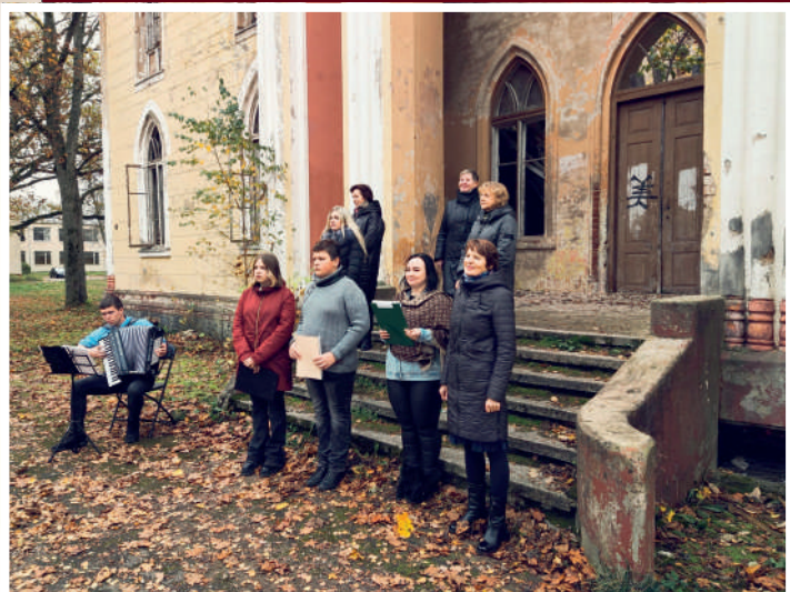
Lyrinis vakaras Raudondvario dvaro kieme