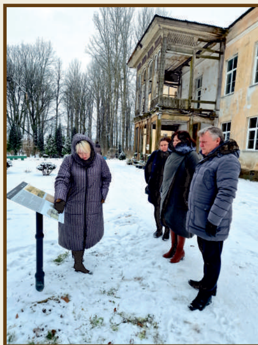
Viešosios bibliotekos informacija ir nuotraukos