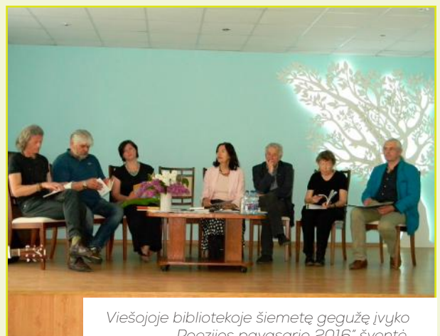
Viešajoje bibliotekoje šiemetę gegužę įvyko „Poezijos pavasario 2016“ šventė. Nuotraukoje – jos dalyviai