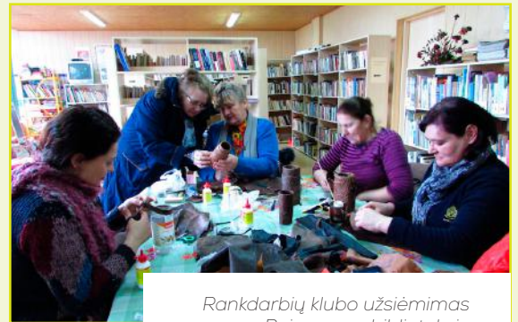
Rankdarbių klubo užsiėmimas Beinoravos bibliotekoje