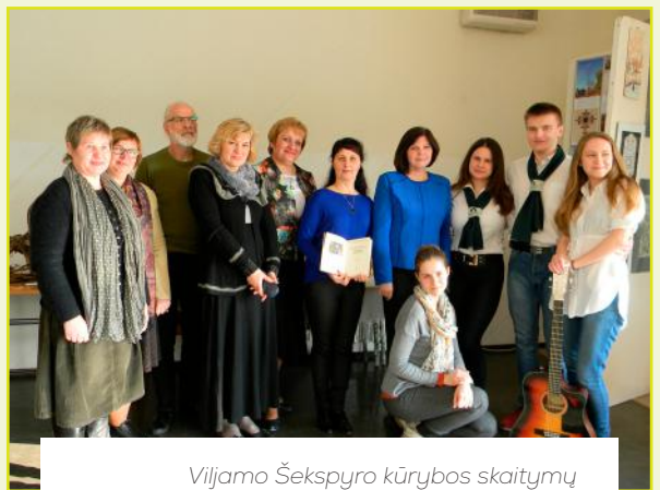
Viljamo Šekspyro kūrybos skaitymų Radviliškyje dalyviai