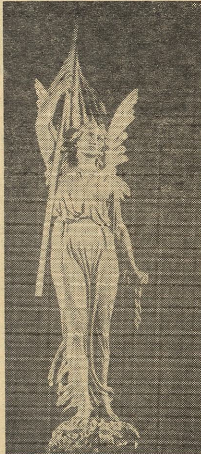
Išlaisvinta Lietuva (dail. J. Zikaro skulptūra).

1905 metais į Lietuvą sugrįžta daugelis ištremtų veikėjų. Jų tarpe