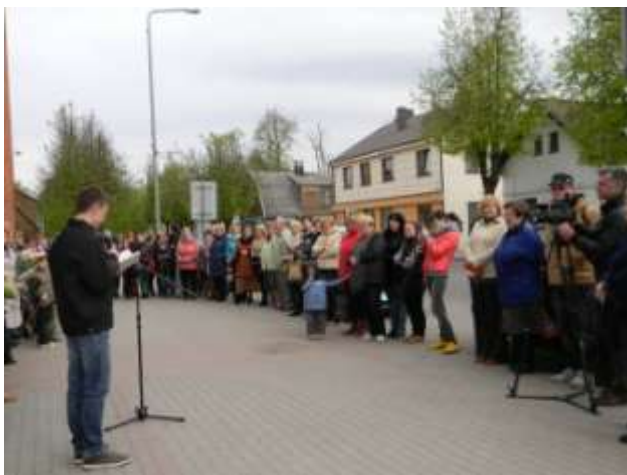
Akcija prasidėjo prie Viešosios bibliotekos

Po skaitymų visi, susirinkę prie Viešosios bibliotekos, buvo pakviesti į „Būrų kiemelį“, kur, skambant nuotaikingai muzikai, galėjo pasivašinti senoviškais valgiais ir gėrimais, pasiklausyti Radviliškio vaikų darželio „Eglutė“ piemenėlių programėlės.