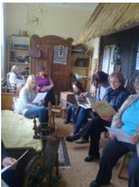
Šniūraičių etnografiniame muziejuje skambėjo K. Donelaičio kūryba