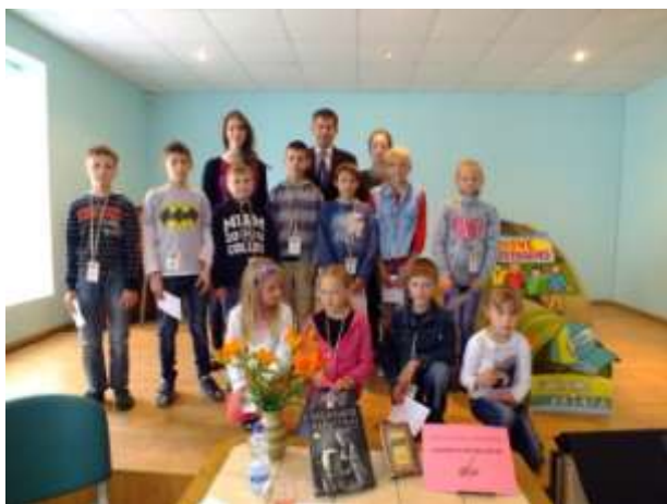
Stovyklautojai su dailininku A. Seselsku

Stovyklautojai susitiko su dailininku Andriumi Seselsku, kurio iliustruota knyga „Vilniaus padavimai“ pernai pripažinta stilingiausiai iliustruota metų knyga paaugliams (leidykla „Niekio rimto“).