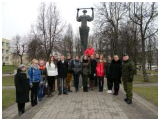
Prie paminklo pergalėi prieš bermontininkus