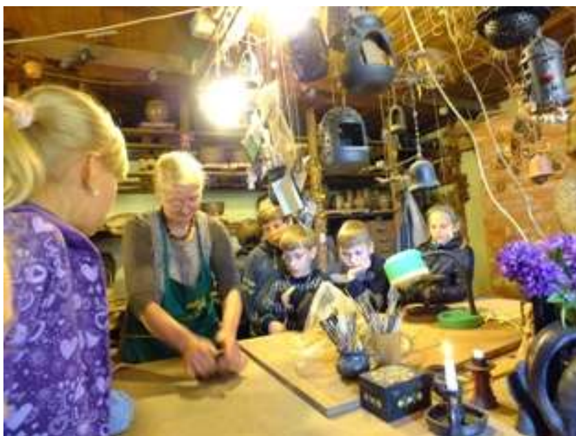
Svečiuose pas keramikos dirbtuvių savininkus

Dar vienas įdomus reginys šioje išvykoje buvo Naisių kaimo bendruomenės kultūros namuose pamatytas spektaklis „Beprotiškai fantastiškos Maestro Vytauto Kernagio dainos“ ir aplankytas Inkilų muziejus po atviru dangumi.