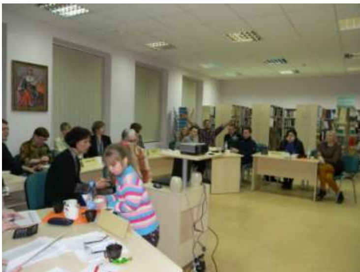
„Europrotų“ žaidimo akimirkos

Po penkių turų susumuoti rezultatai. Pirmąją vietą iškovojo komanda „Pabėgių meldai“. Antrąją vietą pelnė „Radviliukai“, trečiąją – „Erdviniai“. Nugalėtojai apdovanoti Europos Komisijos atstovybės prizais, „Europrotų“ diplomais, Viešosios bibliotekos dovanomis.