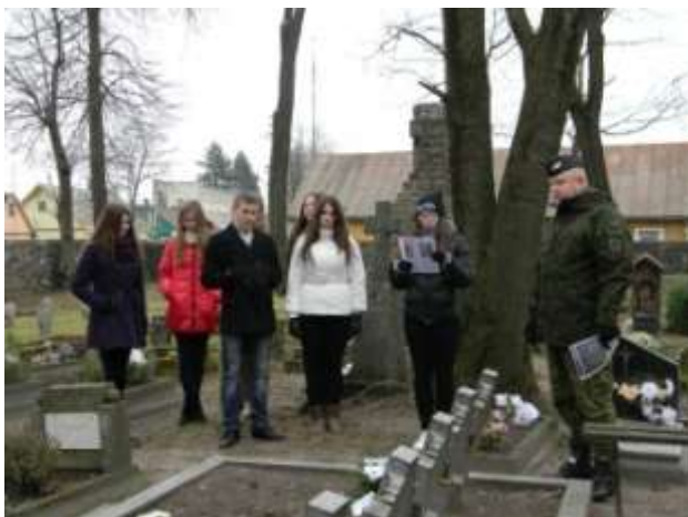
Viktorinos dalyviai aplankė savanorių kapus Radviliškyje