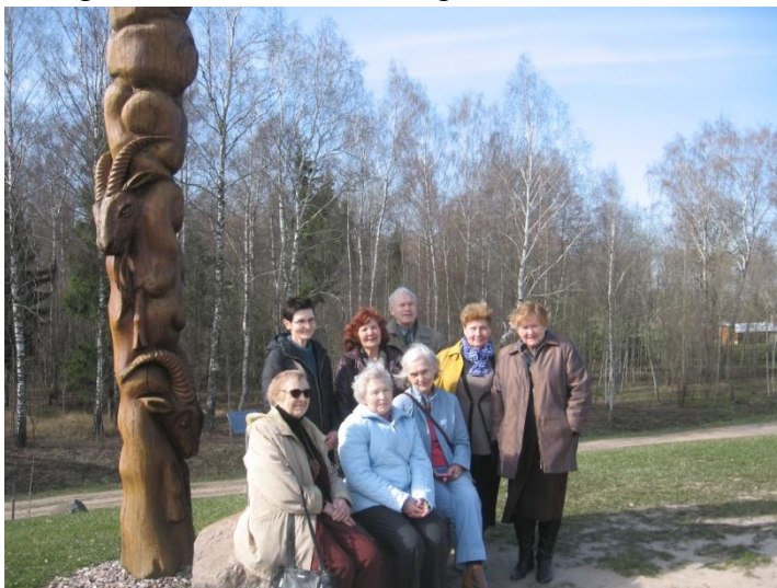
„Beržės“ narių išvyka į Naisius