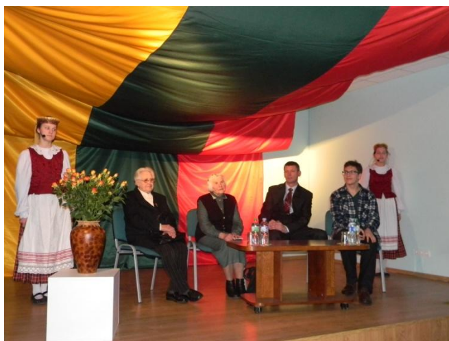
Vasario 16-osios šventės svečiai Viešojoje bibliotekoje