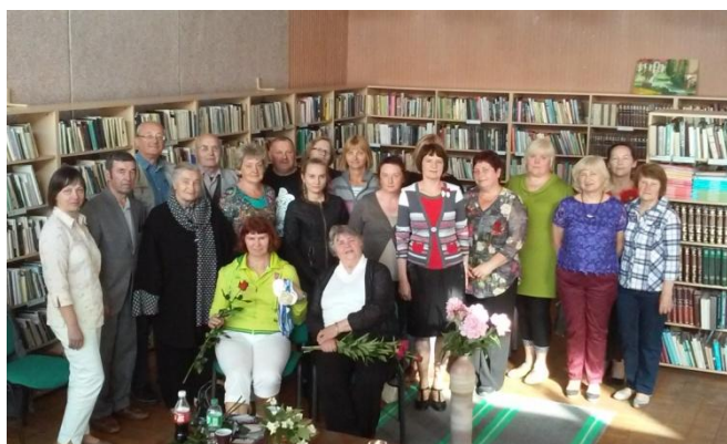
Raudondvario bibliotekoje – kraštą garsinantys žmonės

Bibliotekoje buvo eksponuojami Aleksandros Kairienės rankdarbiai, veikė Rimo Benaičio fotografijų paroda.