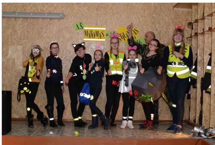
Baisogalos vaikų madų šou