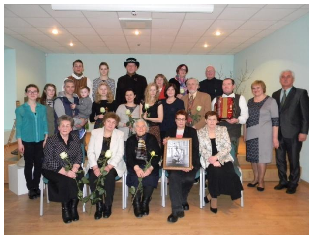
Renginio „Vadinkite mane sėjėju“ svečiai ir organizatoriai