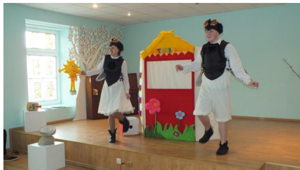
Lizdeikos gimnazijos gimnazistų pasirodymas