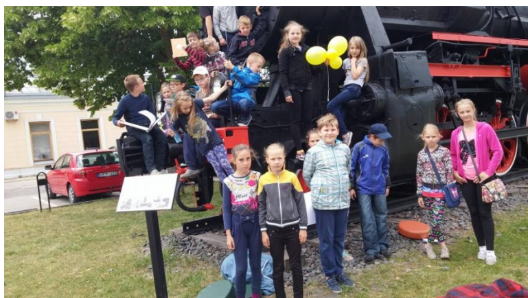
Vaikų vasaros skaitymai prie Radviliškio miesto simbolio – garvežio