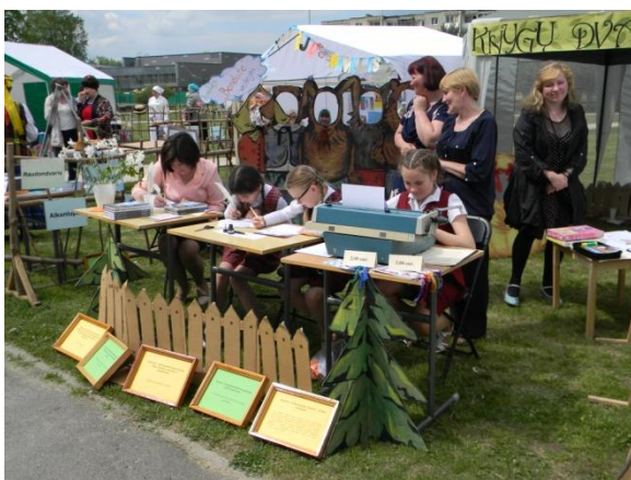
„Pavasarinio knygų kermošiaus“ kiemeliuose