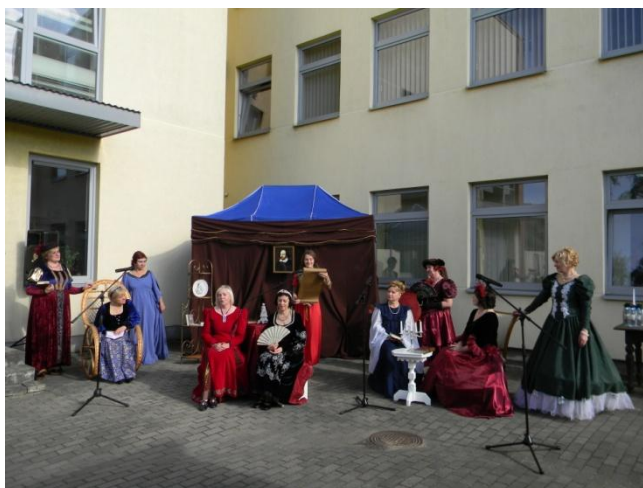
V. Šekspyro sonetų teatralizuoti skaitymai Viešosios bibliotekos kiemelyje

Pavasariį Latvių kultūros centre prasidėję V. Šekspyro kūrybos skaitymai baigėsi ketvirtuoju skaitymu „Tikroji meilė – tai žvaigždė skaiti...“ renginiu, rugsėjo 9-osios popietę, vykusiu Viešosios bibliotekos kiemelyje. Tai buvo šio pasaulinio garso kūrėjo laikus atspindintis teatralizuotas pasirodymas. Viešosios bibliotekos bibliotekininkės ir prie jų prisijungę miestiečiai V. Šekspyro sonetus skaitė, vilkėdami ano šimtmečio rūbais.