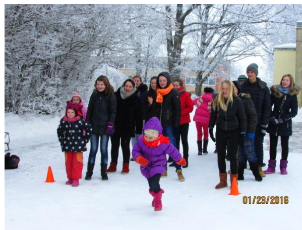
Renginys sulaukė įvairaus amžiaus beinoraviškių