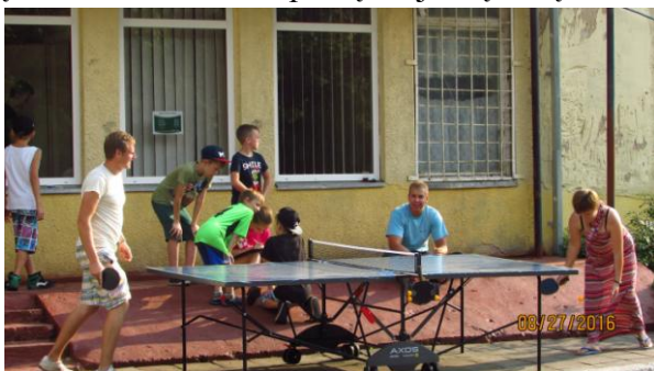
Šventės metu prie bibliotekos Beinoravos kaimo vaikams surengtas stalo teniso turnyras

Visi šventės dalyviai gavo po balto popieriaus lapą, ant kurio užrašė savo svajones ir sudėjo į šventės simboliu tapusių svajonių dėžę.