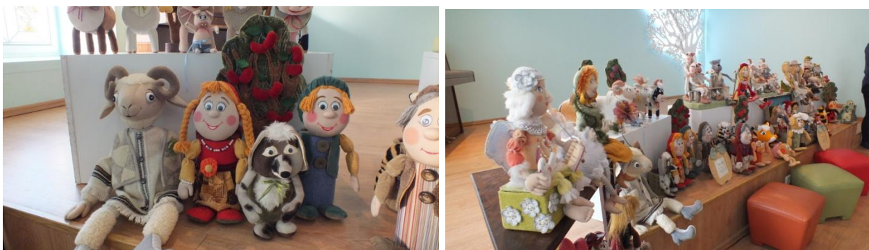
A. Liaudanskienės lėlės demonstruotos Viešosios bibliotekos konferencijų salės scenoje

Šeimos diena buvo skirtas renginys „Diena, kuri kviečia ir jungia“, organizuotas kartu su lopšelio-darželio „Eglutė“ „Želmenėlių“ grupės vaikais ir jų tėveliais, auklėtojomis. Tą dieną vaikai atvedė savo tėvelius į biblioteką. Buvo apdovanoti gausiausiai savo „skaitymo medžius“ išauginę grupės vaikai. Susirinkusiesiems parodyta G. Lukšaitės miniatiūra „Žvėreliai apie skaitymo naudą“. Darželinukai įsigijo bibliotekos Skaitytojų pažymėjimus.