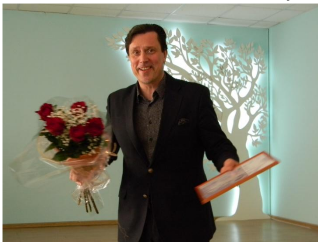
Viešosios bibliotekos globėjas Vytautas Juozapaitis

16-osios nacionalinės Lietuvos bibliotekų savaitės, kaip ir visų Bibliotekų metų, moto – „Stipri biblioteka – stipri visuomenė“. Balandžio 25 d. Viešojoje bibliotekoje surengtas iškilmingas šios teminės savaitės atidarymas, kuriame dalyvavo LR Seimo narys, Radviliškio miesto garbės pilietis, profesorius, kraštievis Vytautas Juozapaitis. Renginyje jis tituluotas Viešosios bibliotekos globėju, jam įteiktas tai liudijantis pažymėjimas. „...Būsiu ne tik globėjas, bet ir ambasadorius, Radviliškio viešosios bibliotekos atstovas...“ – savo sveikinimo kalboje sakė V. Juozapaitis.