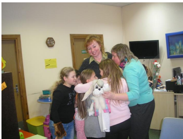
„Mažieji boružiukai“ šventė 5 m. gimtadienį