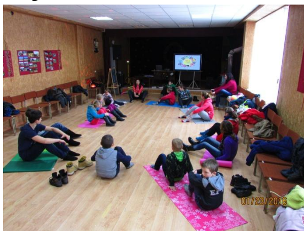
Įsimintinos šventės Beinoravoje dalyvių laukė įdomūs ir naudingi užsiėmimai

Po pietų į renginį rinkosi moterys. Bibliotekoje profesionali sportininkė joms skaitė paskaitą apie sportą, mitybą, aktyvumą bei energiją. Vakare į biblioteką rinkosi paauglės merginos, pizamų vakarėlio „Naktis bibliotekoje“ dalyvės. Vakarėlio metu žiūrėti filmai apie aktualias jaunų žmonių problemas, dalytasi išpūdžiais, kalbėtasi įvairiomis temomis, juokauta, užrašyti norai ir troškimai patalpinti į svajonių dėžutę, o visa, kas buvo bloga, pykčiai ir nuoskaudos, sudėti į vokus ir sudeginti lauke.