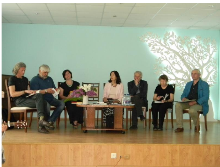
„Poezijos pavasario 2016“ dalyviai Viešojoje bibliotekoje