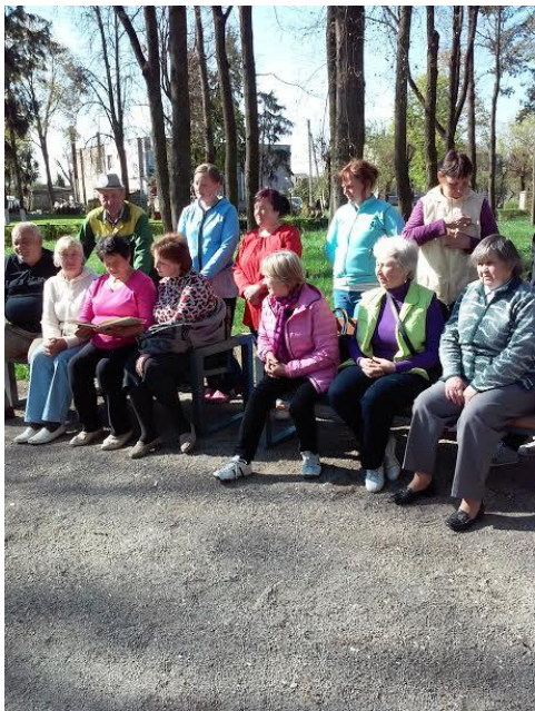
Skaitymai Šeduvos miesto parke

Akcija rajone organizuota įvairiose erdvėse: Beinoravos bibliotekos kiemelyje, žydinčių tulpių apsuptyje, Šeduvos miesto parke, Sidabravo gimnazijos kiemelyje, gražioje Raudondvario buvusio dvaro aplinkoje ir kitur.