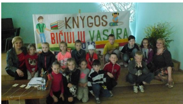
Vasaros stovyklą atidarant