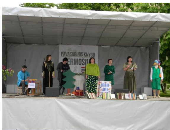
Baisogaliečių pasirodymas šventės didžiojoje scenoje