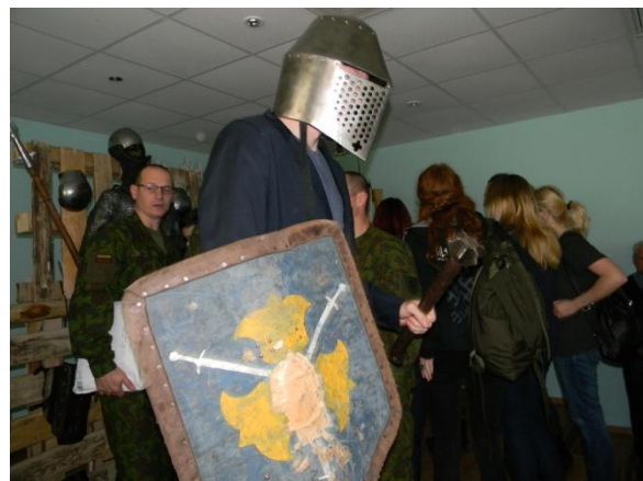
Dalyviai susidomėjo senosios ginkluotės paroda